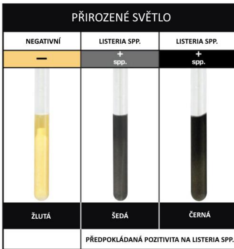
Obrázek 2. Interpretace změny barvy média

Pro ověření přítomnosti bakterií rodu Listeria v pozitivním vzorku doporučuje Hygienea otestovat inkubované médium z testu InSite specifičtější metodou (např. PCR, ELISA nebo lateral flow).