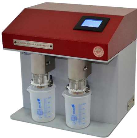
GLUTEN WASHING DEVICE - Y07