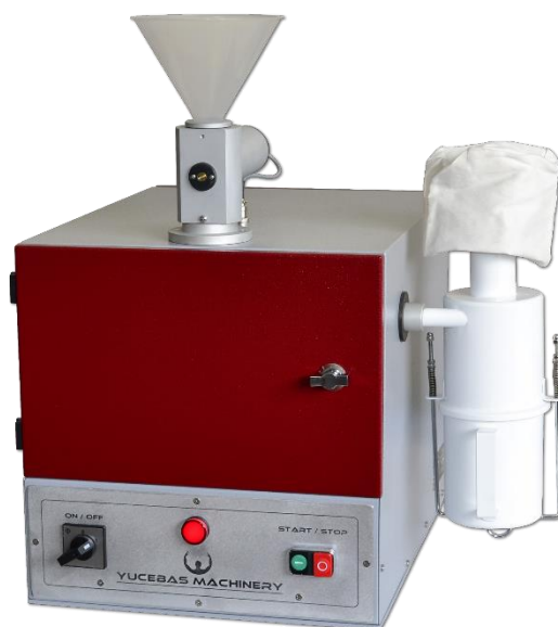
HAMMER MILL - Y17

YUCEBAS MACHINE ANALYTICAL EQUIPMENT INDUSTRY Fatih Mahallesi 451 Sokak No: 6 Helvacı / Aliağa / İZMİR / Turecko Tel : + 90 232 627 90 07 www.yucebasmake.com.tr