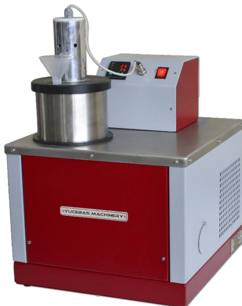
HEATED AND COOLED WATER TANK - Y14.3