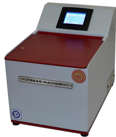
GLUTEN INDEX DEVICE - Y08