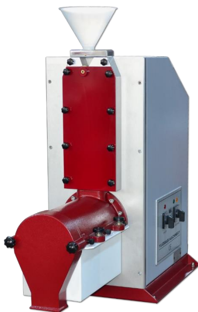
COMBINED MILL - Y16